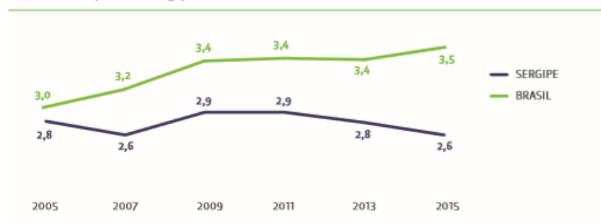
GRÁFICO 1 | Ideb Sergipe x Brasil

FONTE: INEP Elaboração: Instituto Unibanco – Gerência de Gestão do Conhecimento