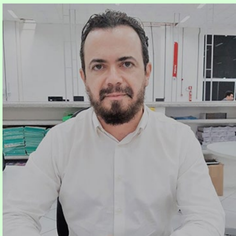
A SES mantém diálogo constante com os municípios

Segundo o documento emitido pelo Centro de Informações Estratégicas em Vigilância em Saúde de Sergipe (CIEVS), no dia 7 de maio a Agência de Segurança da Saúde do Reino Unido (UKHSA) reportou o primeiro caso de Monkeypox que, acredita-se, tratar-se de um caso importado [Quando vem de outro país].